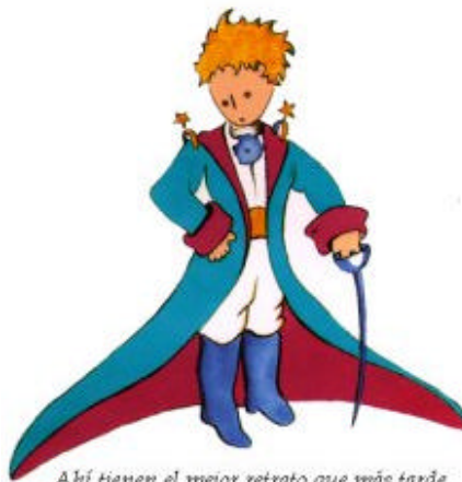
Aquí tienen el mejor retrato que más tarde logré hacer de él

Me puse en pie de un salto como herido por el rayo. Me froté los ojos. Miré a mi alrededor. Vi a un extraordinario muchachito que me miraba gravemente. Ahí tienen el mejor retrato que más tarde logré hacer de él, aunque mi dibujo, ciertamente es menos encantador que el modelo. Pero no es mía la culpa. Las personas mayores me desanimaron de mi carrera de pintor a la edad de seis años y no había aprendido a dibujar otra cosa que boas cerradas y boas abiertas.